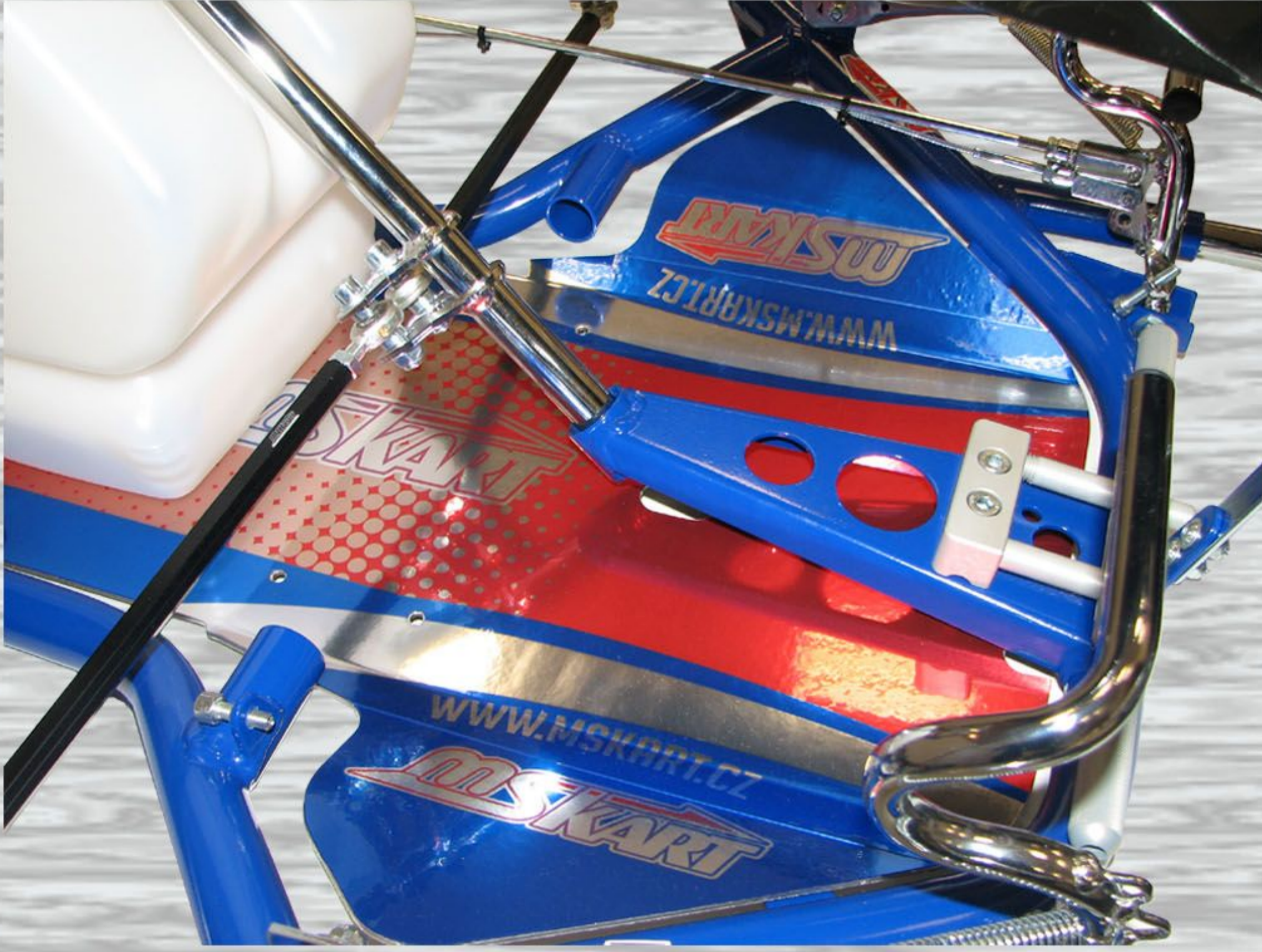
Obr. 1 a 8